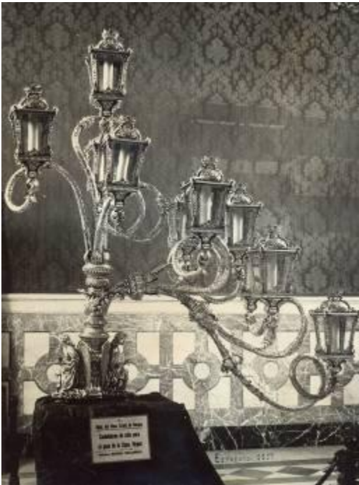
1958 Candelabros de cola de Villarreal en la exposición de estrenos de Semana Santa. salón Colón del Ayuntamiento de Sevilla