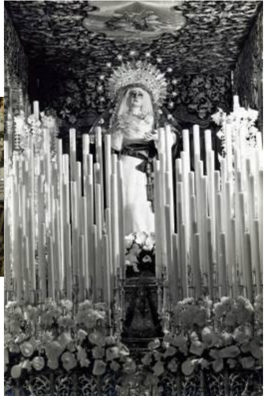
1953 Madre de Dios de la Palma luce con la diadema de Seco, se observa el detalle de los respiraderos neogóticos con el escudo corporativo en el centro ambos estrenos de 1931, en la delantera la pequeña imagen de la Virgen del Rocío, gran sencillez en la vestimenta de la Dolorosa saya blanca lisa con cíngulo. Llama la atención las velas rizadas

El mismo cabildo general del 12 de Octubre de 1954 que aprobó el título para Sevilla fue el que acordó los diseños de Caro para los respiraderos y curiosamente un acuerdo que no se cumplió, se trataba de cambiar el antiguo escudo bordado de la bambalina delantera por el de la ciudad de Sevilla.