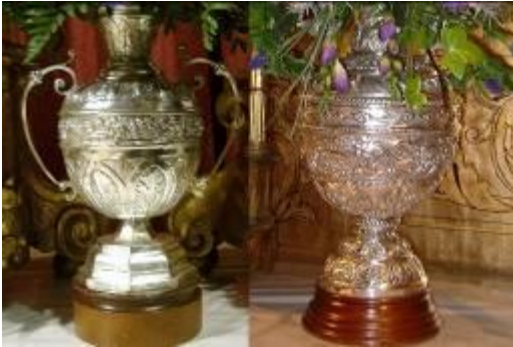
A la izquierda una de las jarras de 1935 de Seco Velasco y a la derecha una del juego actual de Villarreal que se estrenaron en 1961