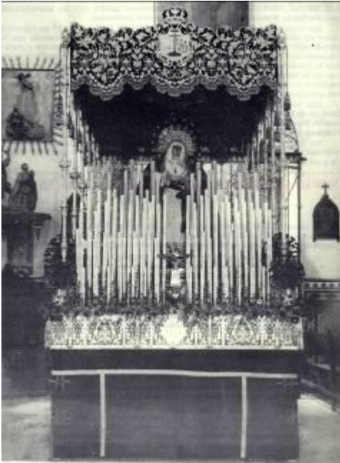
1950, con la pequeña imagen del Cristo de Burgos en la delantera los antiguos respiraderos y el exorno floral con claveles rojos.

Durante los primeros años del paso de palio la Virgen lucía saya y manto liso, sin bordados.