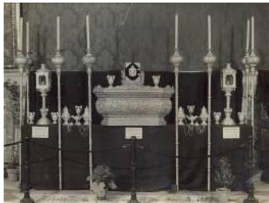
1953 En el salón Colon del Ayuntamiento de Sevilla de la exposición de estrenos de la S.S, se exhibieron: 2 faroles de entrevarales, juego de 8 jarritas pequeñas, peana, libro de reglas, 8 ciriales, 4 incensario y 2 navetas, todo del taller el orfebre José Sánchez Torres.

Los candelabros de cola con farolitos son del año 1958, se trata de una de las piezas más singulares y originales con un diseño novedoso al rematar los brazos de los candelabros con farolitos en lugar de los habituales guardabrisas; cada uno posee diez farolitos y su anclaje al paso dispone la posibilidad de dos posiciones de manera que permite recogerlos hacia adentro para la salida y entrada.