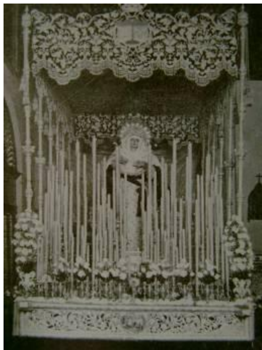
1928-1931 Primera composición con respiraderos, jarras y candelera probablemente prestados