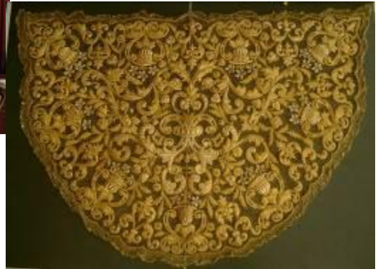
Toca de sobremanto de sobrinos de José Caro estrenada en 1963

En el ajuar de la Dolorosa atesoramos tres “sayas de salida” bordadas en oro, una blanca que es la más antigua restaurada recientemente, desconocemos el año de su ejecución y el autor; una azul de la hermanas Martín Cruz de 1957, y