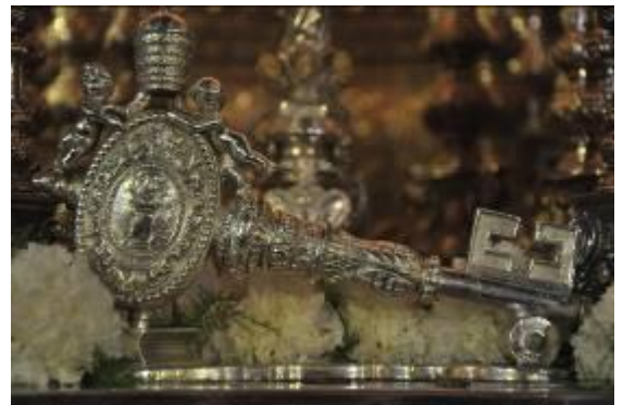
Llamador de Villarreal de los años sesenta