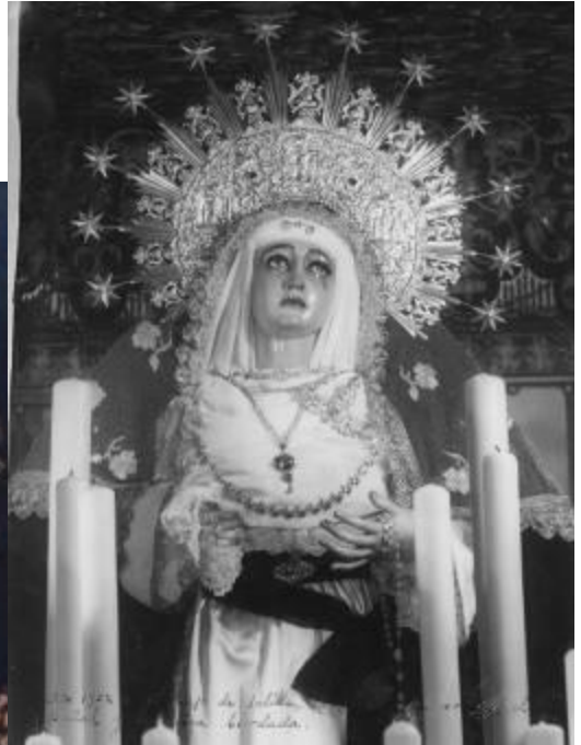
1952 La Virgen luce la diadema de Seco de 1931 y la antigua toca bordada.

del taller de Carrasquilla incluso uno fue rechazado en un cabildo general 4 .