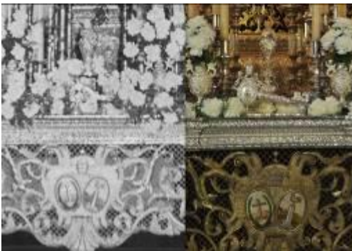
1962 En la foto de la izquierda la pequeña Inmaculada y el antiguo llamado con u sencillo diseño. En la de la derecha de 2010, la Inmaculada con otra peana y el llamador actual de Villarreal