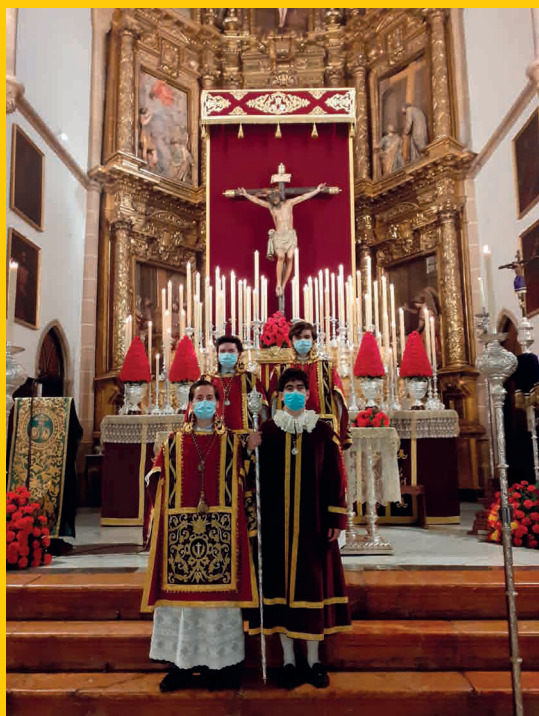
Acólitos Función Principal de Instituto 2021