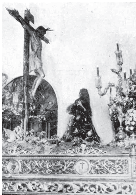
1930. El Crucificado con la Magdalena en el antiguo paso de Misterio