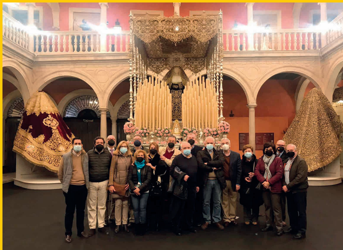
Visita exposición "In Nomine Dei"