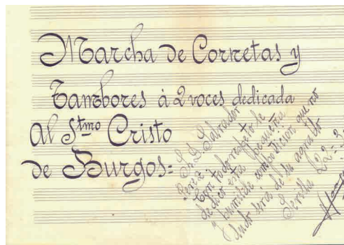
Primera página del documento de la partitura con el título y la dedicatoria

“Al Santísimo Cristo de Burgos” se encua-