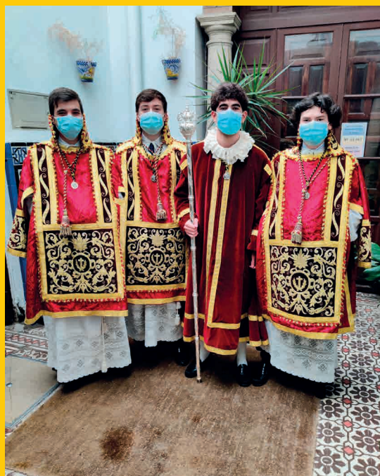
Acólitos Triduo 2020