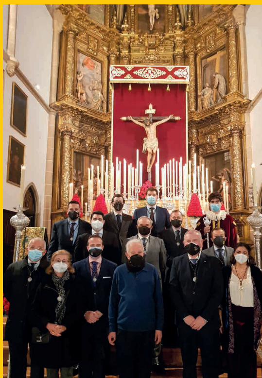
Junta de Gobierno Función Principal de Instituto 2021