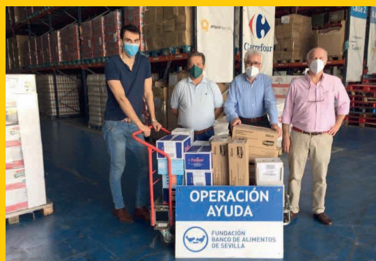
Colaboración con el Banco de Alimentos de Sevilla