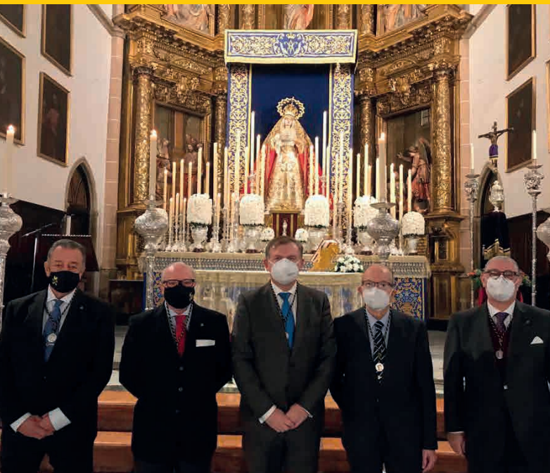
Hermano Mayor y sus antecesores en el Triduo 2020